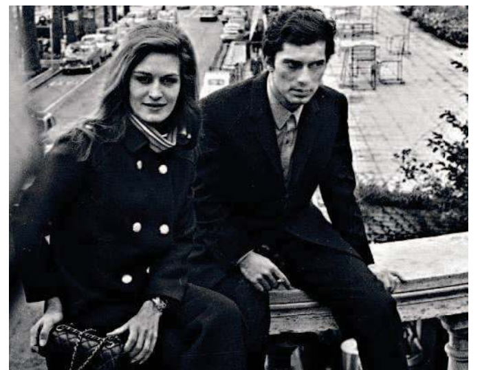
CON LUIGI TENCO

«La sua tristezza. E quella frase, quando l'intervistatore le chiede "lei ha scelto la vita": lei risponde "è la morte che non mi ha voluto". Una piccola frase che racchiudeva l'enorme sofferenza. Per conoscerla è stato fondamentale l'aiuto del fratello Orlando, che le è stato vicino e in fondo è il vero uomo nella vita di Dalida. Per avere il ruolo ho fatto sette provini. All'inizio neanche volevo tentare. Ero a New York in un momento in cui, dopo tanto studio con un'insegnante come Ni-