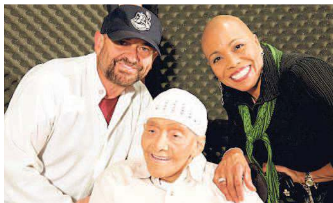
Jimmy Scott tra Joe Pesci e Dee Dee Bridgewater in studio nel 2009 durante la lavorazione dell'album "I go back home"

mento della sua neoetichetta Tangerine, finì al macero; neanche la Atlantic: quando nel '69 fu pubblicato The Source , il mercato era in delirio per la British Invasion e i nuovi eroi del soul, Aretha Franklin in testa.