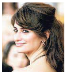
PENELOPE CRUZ L'attrice spagnola è stata per lungo tempo in pole position per interpretare Dalida