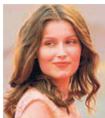
LAETITIA CASTA Anche la francese (38 anni) è stata in lizza per il ruolo di Dalida uno dei più ambiti dalle attrici internazionali